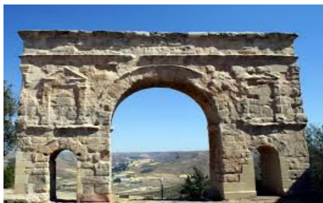
Arco Romano de triple arcada en Medinaceli

Santa María de la Huerta, es un monasterio cisterciense, que se mantiene vivo, en la planta alta viven los monjes seguidores de la regla “Ora et Labora”.