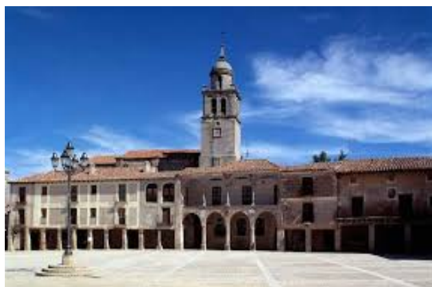
Plaza castellana cerrada, porticada casi pentagonal escoltada por edificios notables.